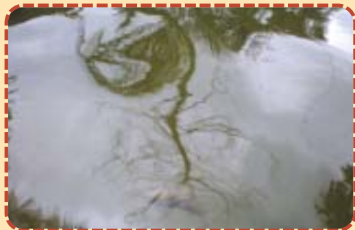
▲青翠入湖：像一棵樹，栽在溪水中