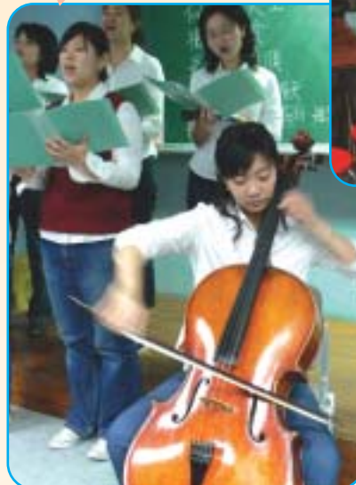
▲琴聲、歌聲、風雨聲：那一夜我們在北大