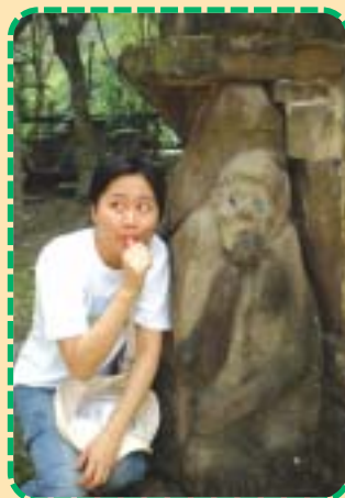
▲東台灣新發現，像極了！