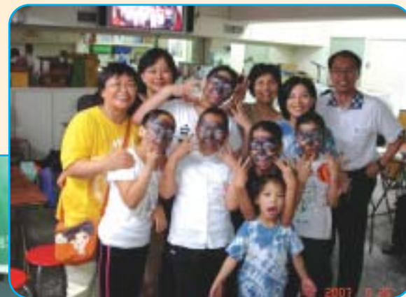
▲黑貓五人組與幕後工作人員：悅樂聲歌音樂會