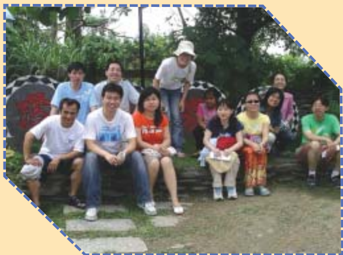
▲這一群尋找山豬的契友