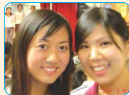
▲本期我們最美麗：最佳「鏡」頭